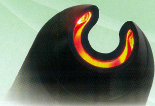
照射領域の絞り込み